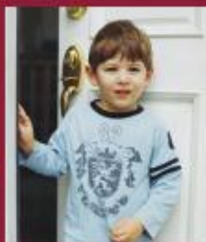
Coloreado por: Ezequiel Reyes 6 años