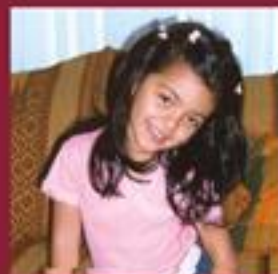
Coloreado por: Francesca Pasquali 4 años

Coloreá los dibujos de los individuales de La Cerrillana y envíalo con tu foto y datos personales a 27 de Abril 885